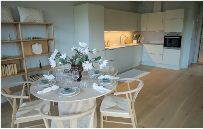
Fra stue og kjøkken.