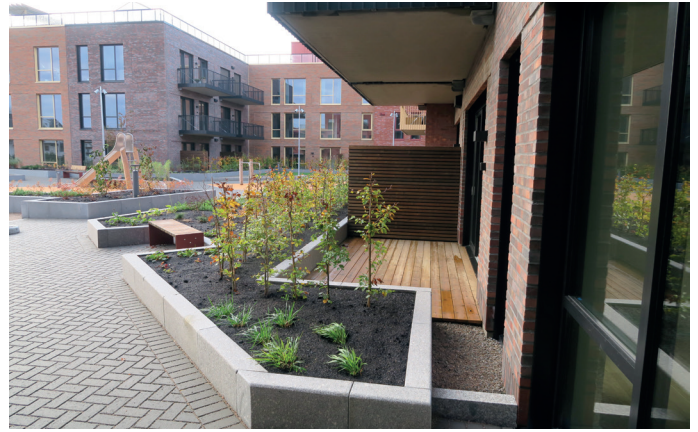
Gårdsrommet har kantstein i granitt.