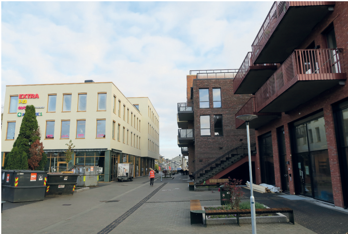
Det lyse næringsbygget har blant annet en dagligvareforretning og et treningssenter.

COWI avd. Fredrikstad har bidratt som rådgivende ingeniører VA, bygningsfysikk og BREEAM.