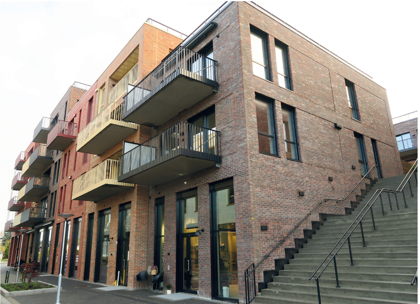
Kombinasjon av flere farger i teglstenfasaden.