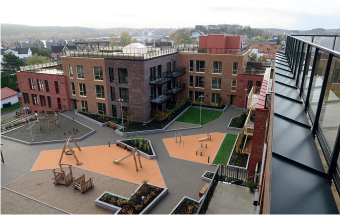
Utsikt fra felles takterrasse.