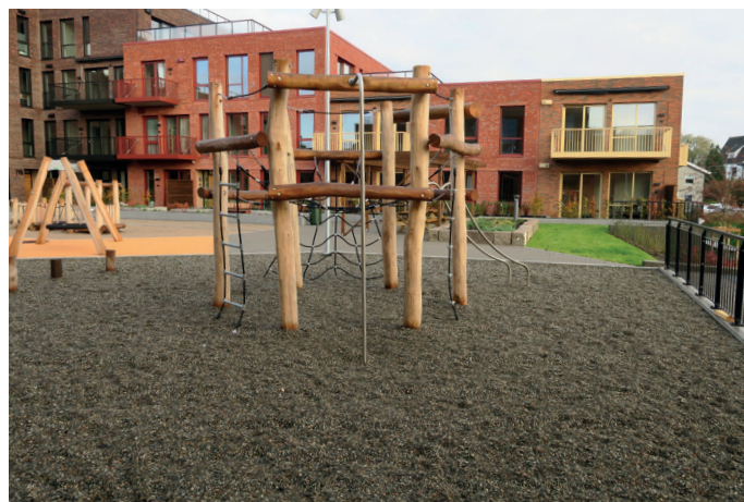
Det luftige gårdsrommet har et stort lekeplassområde.